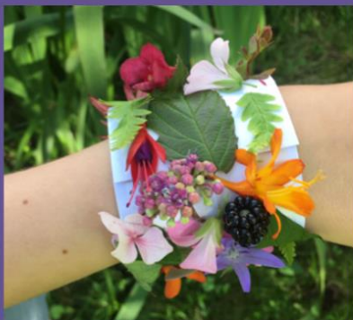
Brațări de flori