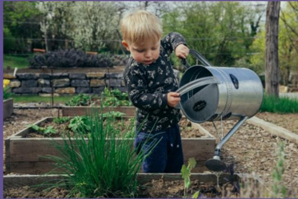
Grădina noastră fermecată: plantare de flori