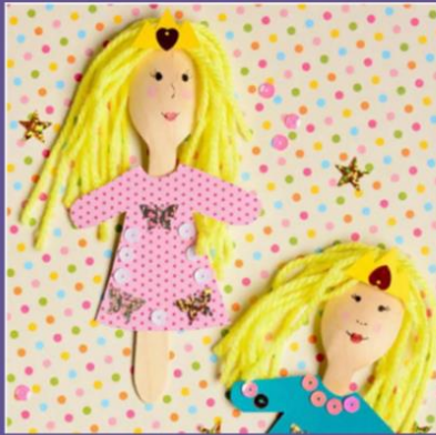
Prințesa din linguri de lemn