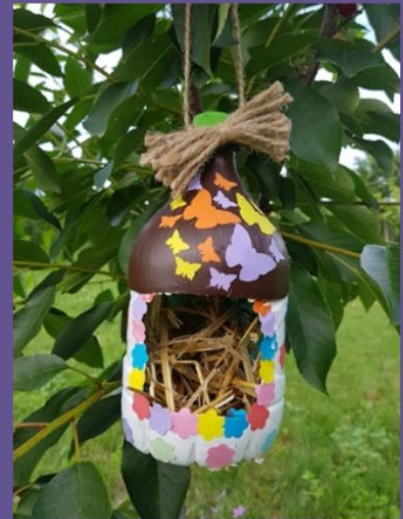
Căsuțe pentru păsări

Dragă Dumnezeu, îți mulțumesc pentru toate ce ai făcut pentru mine și te rog să faci ca să nu mai fie războaie în lume. Mulțumesc pentru că mai trimesc în tabără și te rog dacă nu ești prea ocupat ajută-mă să știu mai multă matematică te rog. TE IUBESC! !! Ași vrea și un răspuns te rog. Al tău copil, cu drag, Matei G dacă poți răspunde pe celaltă parte a foii.