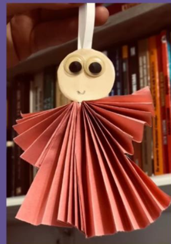
Îngeri din hârtie Tutorial AICI .