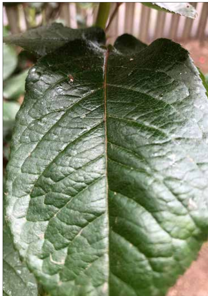
Bucuria luminii — Samirra Khodadadi 13 ani — Focus pe verde