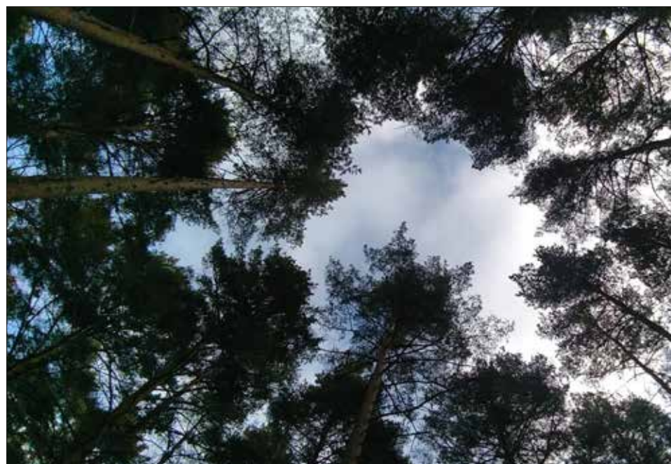
Vară cu albastrele — Bianca Savinescu 13 ani — Cu inima în cer