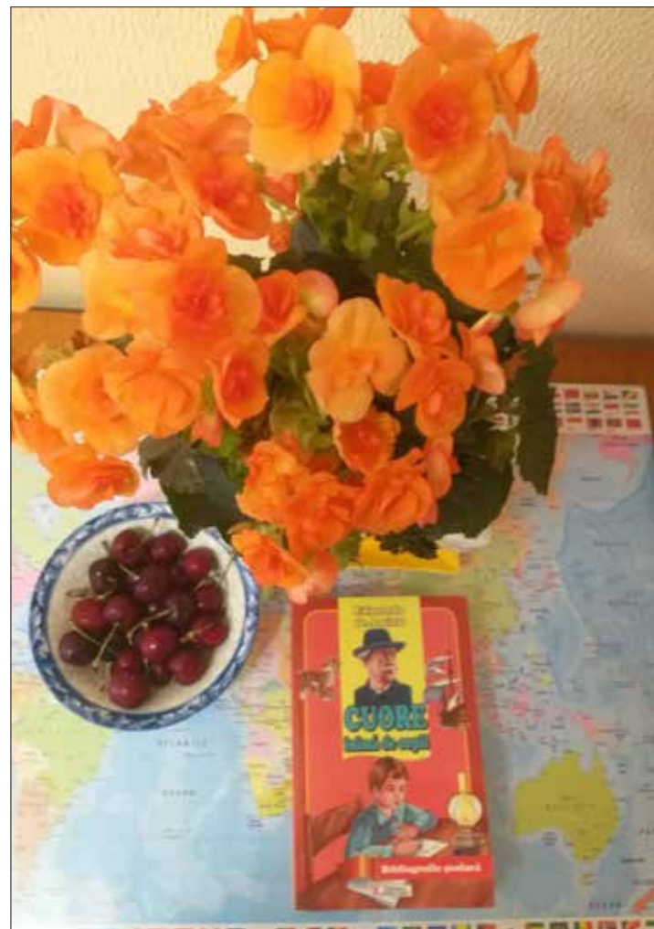
Conversație — Călin Dorobăț, 12 ani — Poftă de bunătați