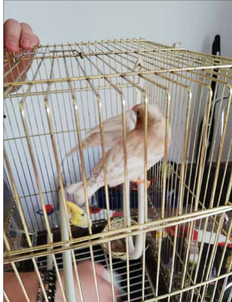
Luca Mihail Hoaghea, 14 ani