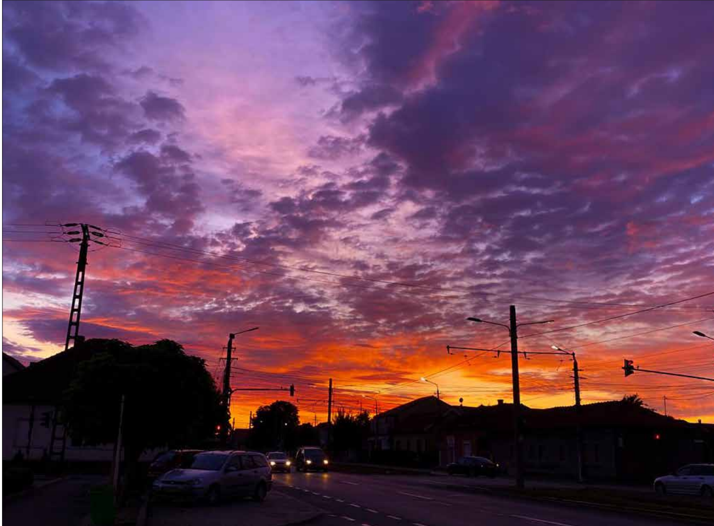
Beatrice Pop, 12 ani