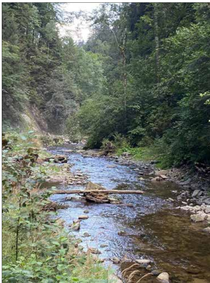
Iustin Panait, 14 ani