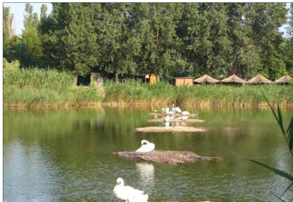
Matei Simion, 13 ani