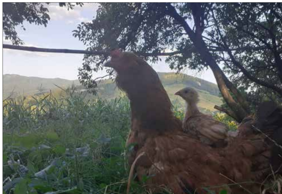
Elena Noapteș, 14 ani