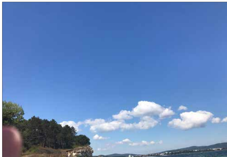
Ecaterina Cârciumaru, 5 ani